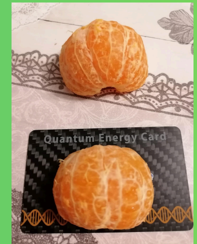
Structurer l'eau et améliorer nos aliments et nos boissons